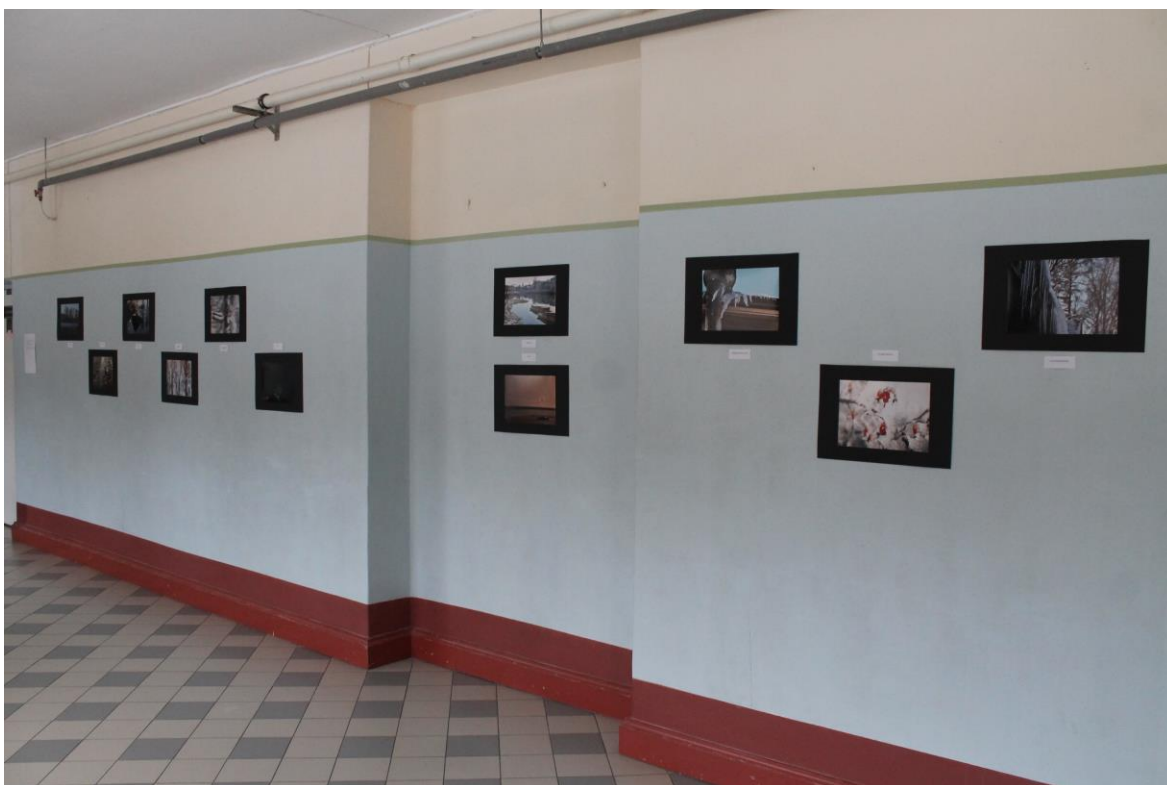
Lisa 1. Fotonäitus kooli koridoris